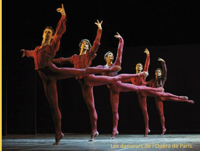
Les danseurs de l'Opéra de Paris.